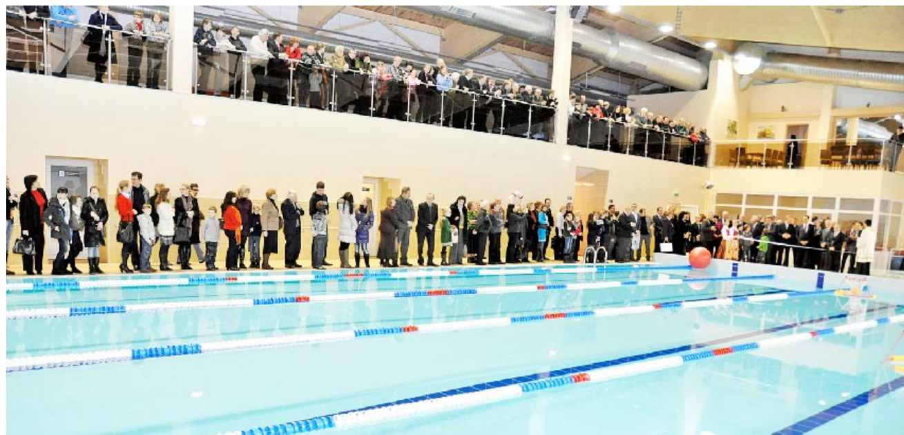
Lūkesčius pranokęs baseinas nuo pat atidarymo pradžios tapo ne tik rajono, bet ir aplinkinių vietovių traukos centru.

Prieš dvejus metus daugelio didesniųjų miestų nuostabi Šakiuose vyko ne tik Lietuvos krepšinio, bet ir Baltijos krepšinio lygos varžybos. Jaunimo kūrybos ir sporto centre žaidė ne tik