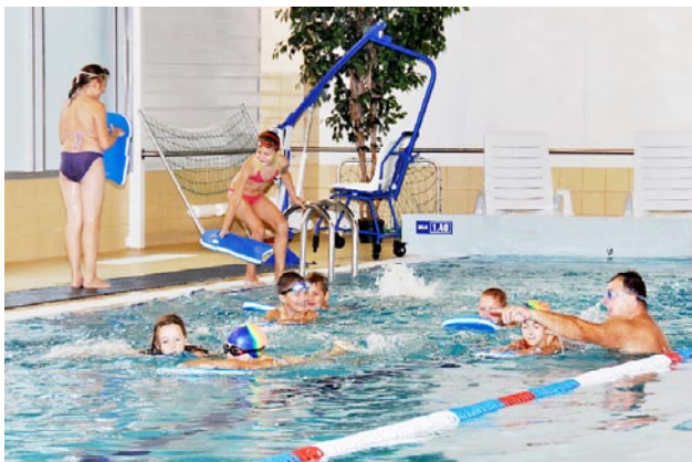
Baseiną noriai lanko įvairaus amžiaus žmonės, vaikams organizuojamos didžiulio susidomėjimo sulaukusių plaukimo pamokos.

Šakių rajono savivaldybės administracijos vykdytas projektas „Šakių jaunimo kūrybos ir sporto centro plėtra“ buvo įgyvendintas pagal ES 2007 – 2013 metų Sanglaudos skatinimo veiksmų programos I prioriteto „Vietinė ir urbanistinė plėtra, kultūros paveldo ir gamtos išsaugojimas bei pritaikymas turizmo plėtrai“ įgyvendinimo priemonės „Viešosios turizmo infrastruktūros ir paslaugų plėtra regionuose“ projektą, kurio vertė 6 mln. 218 tūkst. 554 litai. Būtent pagal šį projektą ir minėtą programą prie sporto salės bei administracinio pastato buvo įrengtas baseinas.